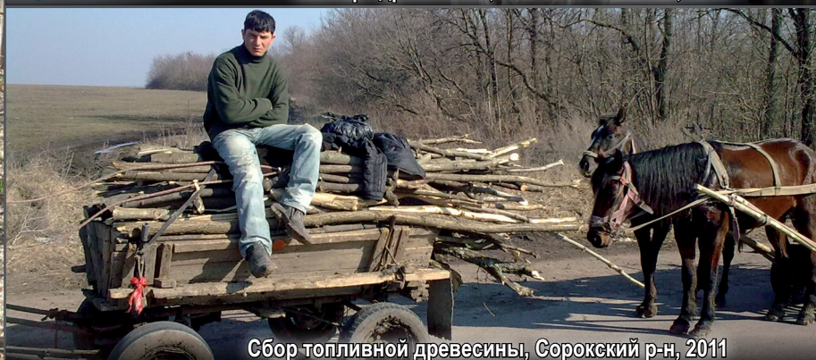
Сбор топливной древесины, Сорокский р-н, 2011