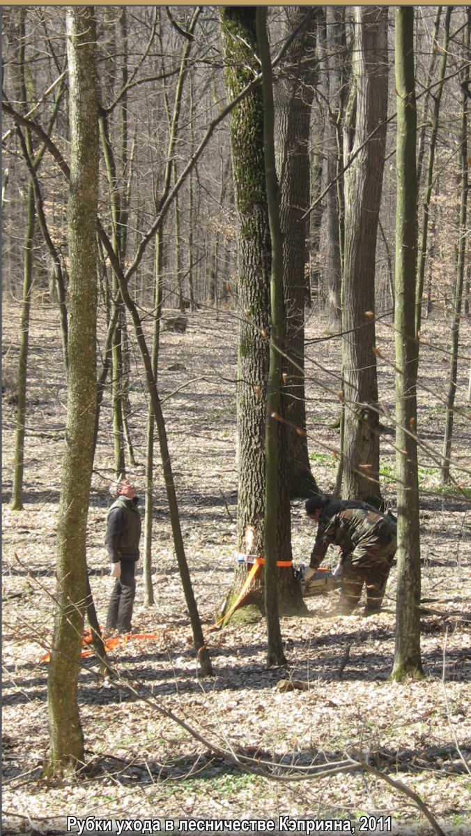
Рубки ухода в лесничестве Кэприяна, 2011