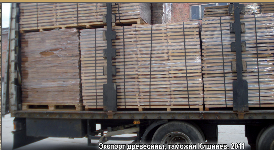
Экспорт древесины, таможня Кишинев, 2011