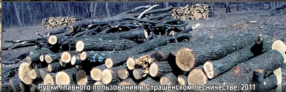
Рубки главного пользования в Страшенском лесничестве, 2011