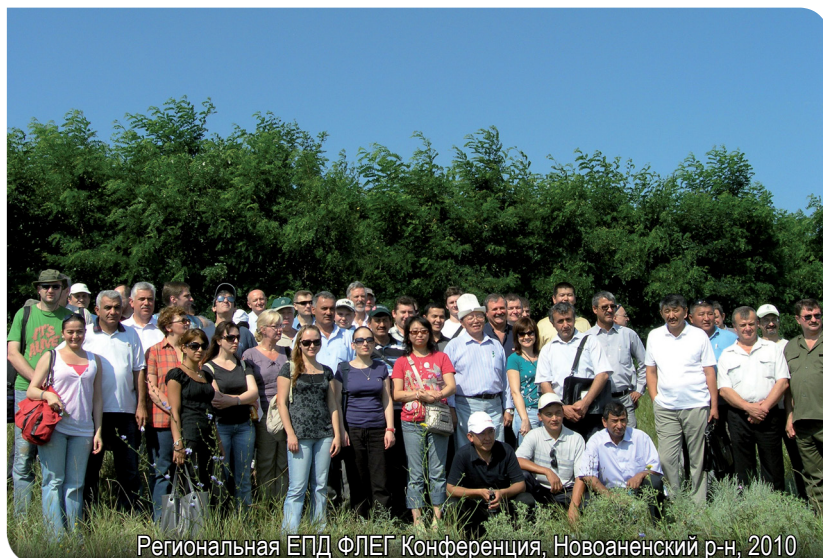
Региональная ЕПД ФЛЕГ Конференция, Новоаненский р-н, 2010

Программа «Совершенствование правоприменения и управления в лесном секторе стран восточного направления Европейской политики добрососедства и России» (ЕПД ФЛЕГ) направлена на оказание содействия государственным структурам, организациям гражданского общества и частному сектору в создании механизмов устойчивого управления лесами, включая сокращение масштабов незаконных рубок и коррупции. Программа разработана в ответ на растущие проблемы связанные с незаконной лесохозяйственной деятельностью в странах-участниках: Армения, Грузия, Азербайджан, Молдова, Украина, Беларусь и Россия. Внедрение программы осуществляется через грантовое соглашение Европейской комиссии с Всемирным Банком, в рамках партнерства с Международным Союзом Охраны Природы (МСОП) и Всемирным Фондом Дикой Природы (ВВФ).