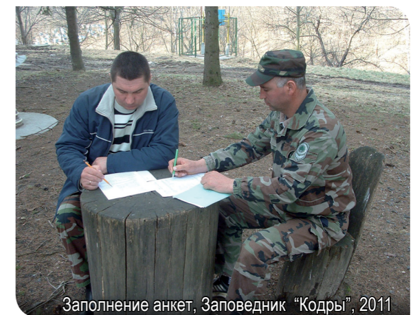
Заполнение анкет, Заповедник "Кодры", 2011